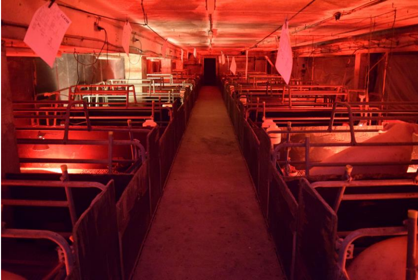
Deutsches Tierschutzbüro e. V.