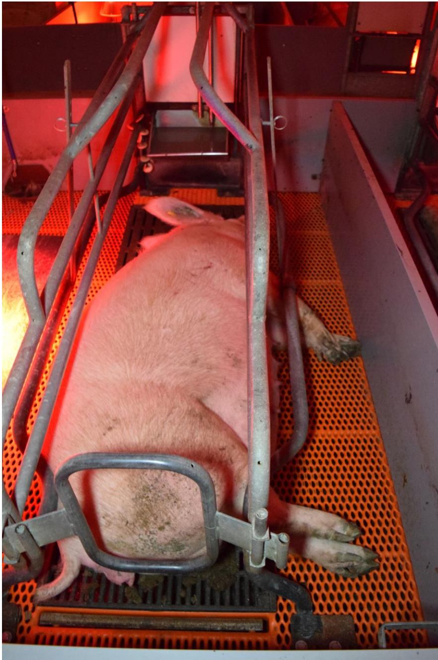
Deutsches Tierschutzbüro e. V.