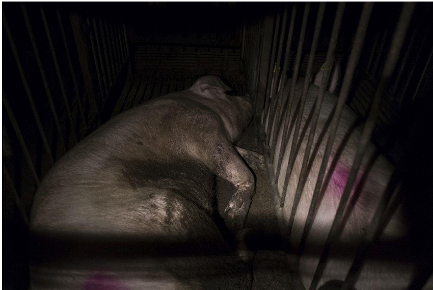
Deutsches Tierschutzbüro e. V.