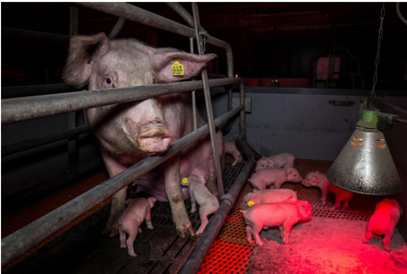
Deutsches Tierschutzbüro e. V.