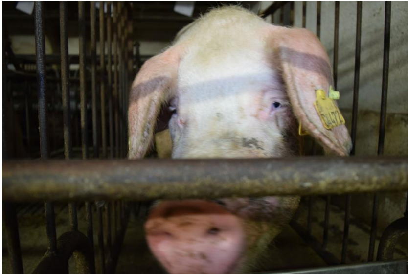
Deutsches Tierschutzbüro e. V.