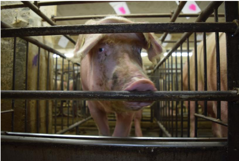
Deutsches Tierschutzbüro e. V.