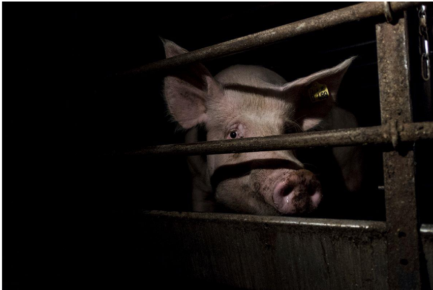
Deutsches Tierschutzbüro e. V.

Nach dem 28. Tag der Besamung muss die Sau grundsätzlich zurück in eine Gruppenhaltung mit anderen Sauen. Zu diesem Zeitpunkt hat die Sau schon fast einen Monat von insgesamt 3 Monaten und 3 Wochen Trächtigkeit hinter sich. Sieben Tage vor dem Abferkeln wird die Sau wiederum in einen Kastenstand verbracht, diesmal in dem sogenannten Abferkelbereich. In diesem Kastenstand muss die Sau ihre Ferkel zur Welt bringen und verbleibt dort bis zum 21. bis 30. Tag nach dem Abferkeln, mithin wieder bis zu fünf Wochen am Stück. Da der Kastenstand im Abferkelbereich anders konstruiert ist als der Kastenstand im Deckzentrum, ist hier ein Ausstrecken der Gliedmaßen möglich. Denn der Kastenstand im Abferkelbereich muss nicht nur die Sau selbst aufnehmen, sondern auch noch deren Ferkel. Die Sau ist in der Mitte der kleinen Bucht durch einen Kastenstand fixiert und kann ihre Gliedmaßen in den Bereich rund um den Kastenstand strecken, in dem sich ihre Ferkel aufhalten müssen. Umdrehen, vor- und zurücklaufen und sich um ihre Ferkel kümmern kann die Sau auch in diesem Kastenstand nicht. Argument der Sauenhalter für die Fixierung der Sau im Kastenstand im Abferkelbereich war es schon immer, dass verhindert werden sollte, dass die Sau ihre Ferkel erdrücke,