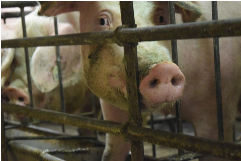
Deutsches Tierschutzbüro e. V.