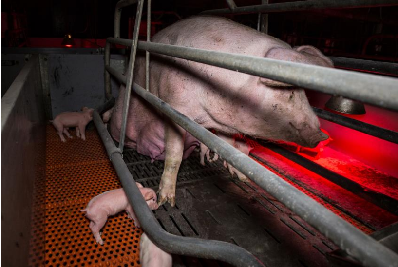
Deutsches Tierschutzbüro e. V.