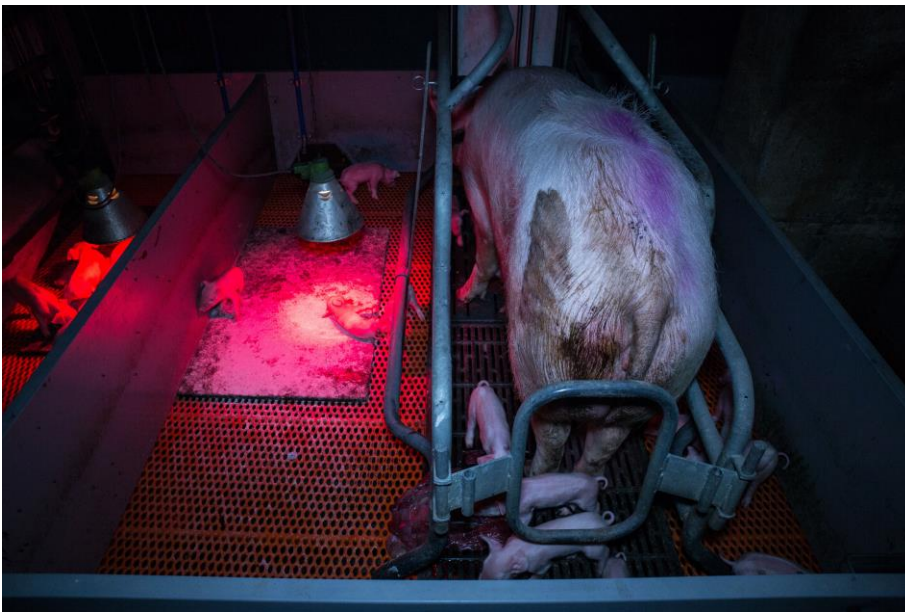
Deutsches Tierschutzbüro e. V.