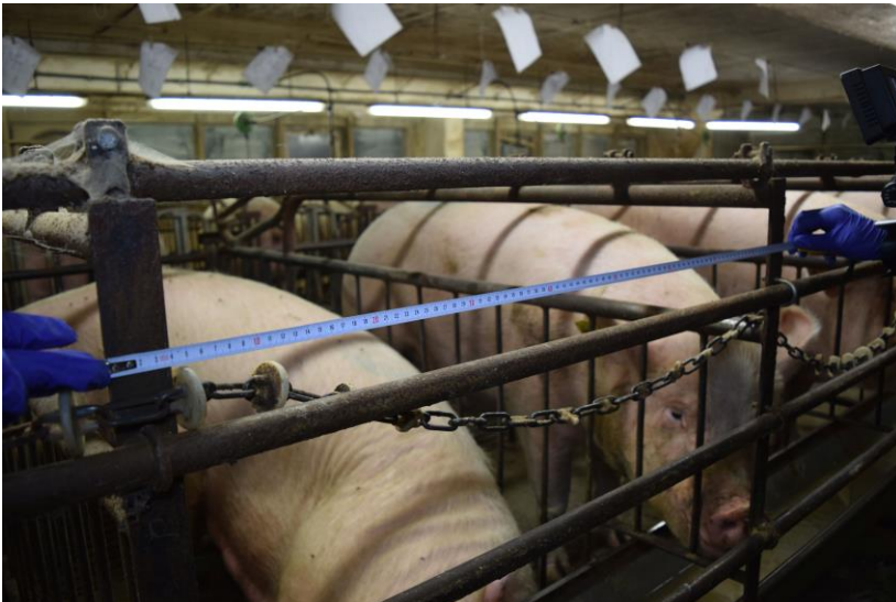
Deutsches Tierschutzbüro e. V.