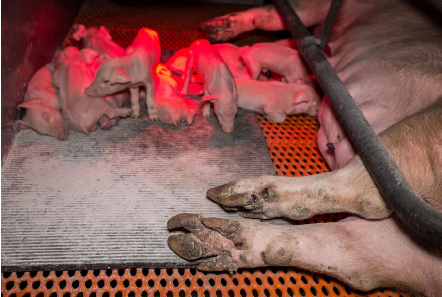
Deutsches Tierschutzbüro e. V.