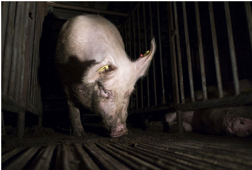
Deutsches Tierschutzbüro e. V.