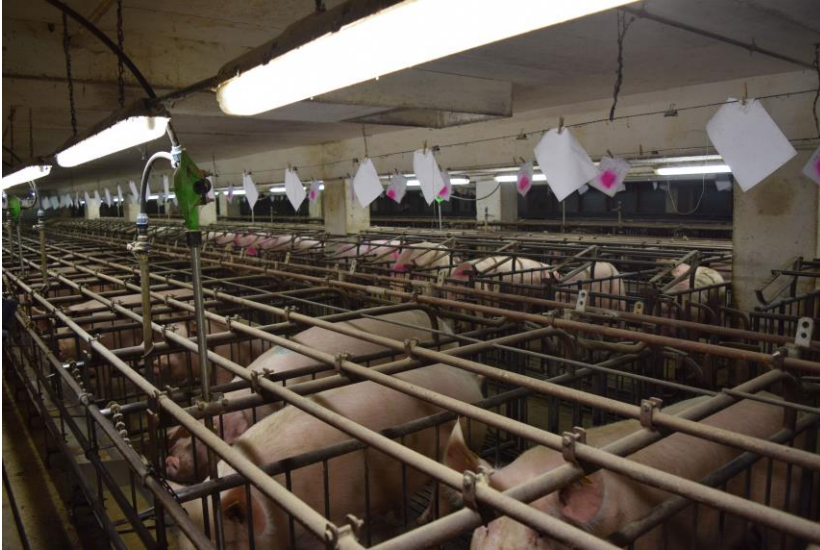
Deutsches Tierschutzbüro e. V.