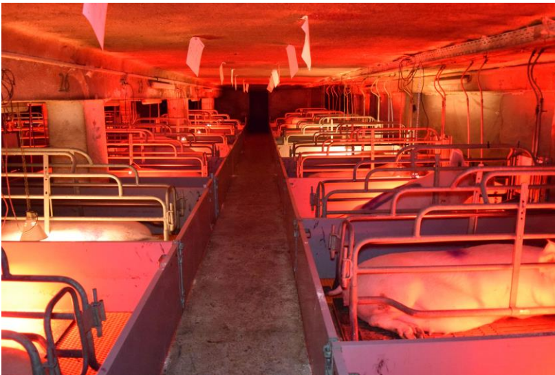
Deutsches Tierschutzbüro e. V.