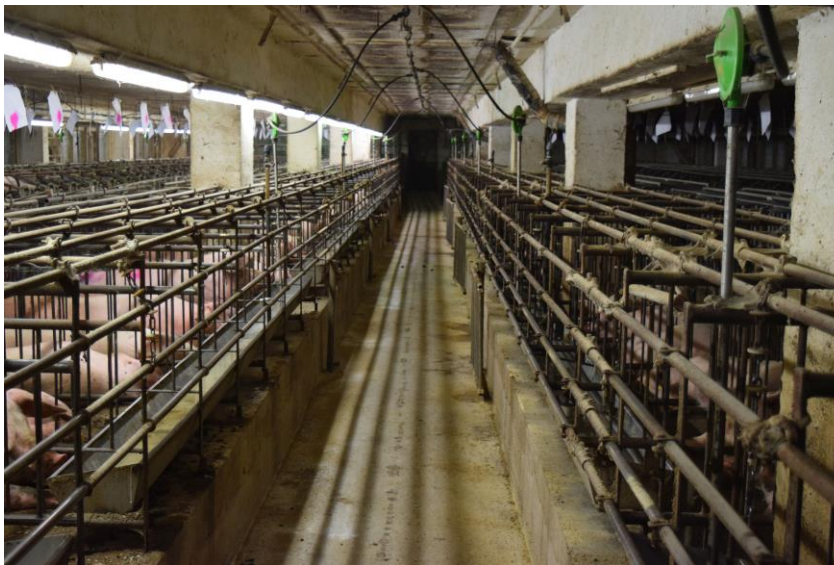
Deutsches Tierschutzbüro e. V.