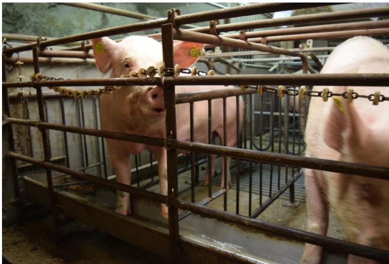
Deutsches Tierschutzbüro e. V.