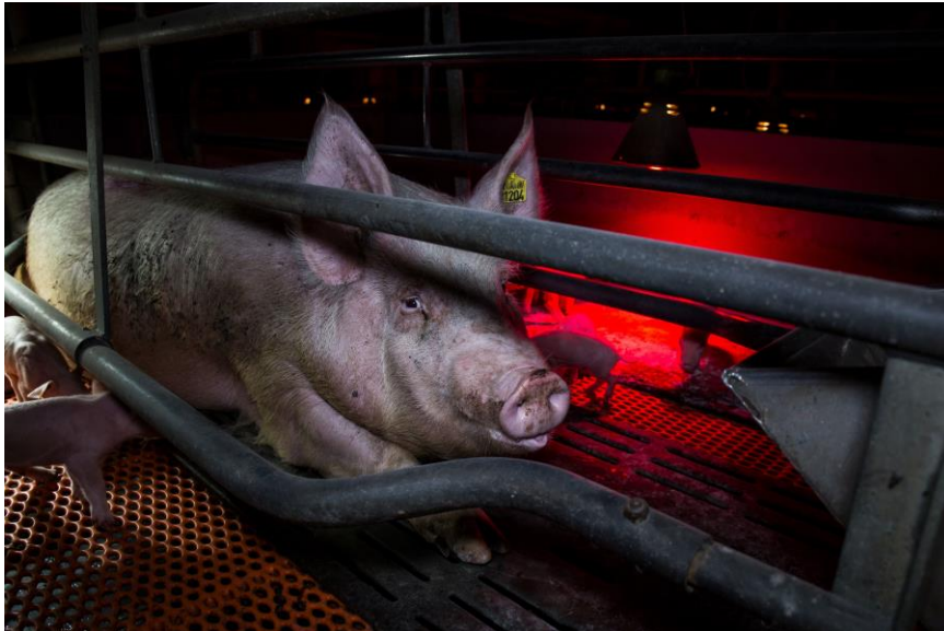
Deutsches Tierschutzbüro e. V.