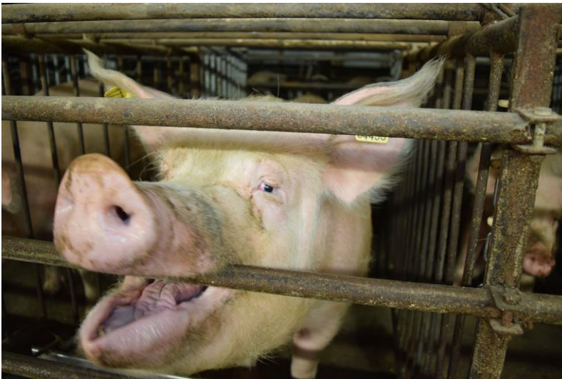
Deutsches Tierschutzbüro e. V.